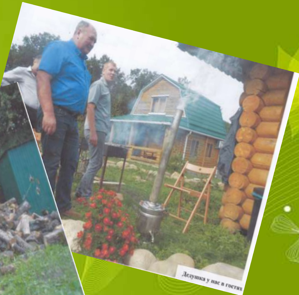
Дедушка у нас в гостях