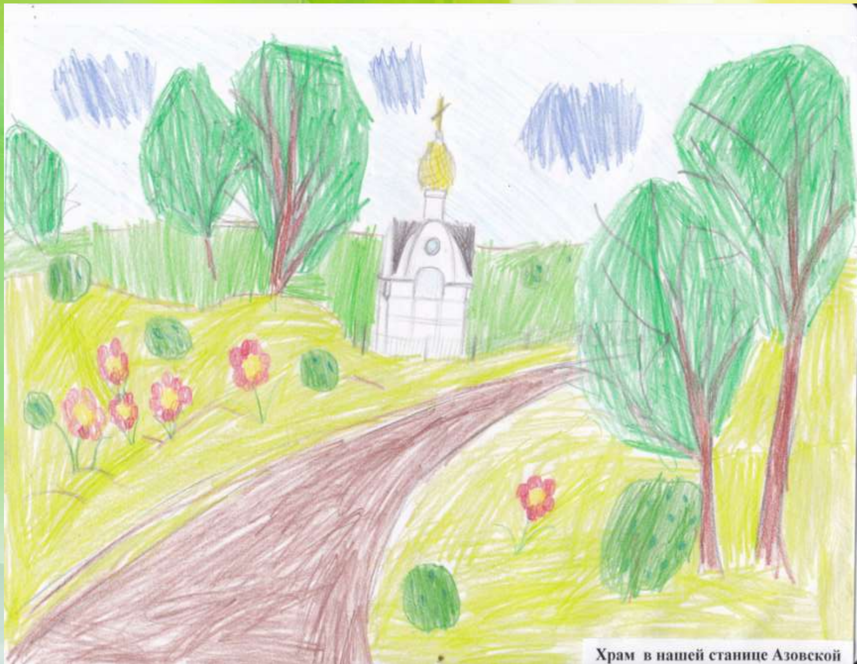
Храм в нашей станице Азовской