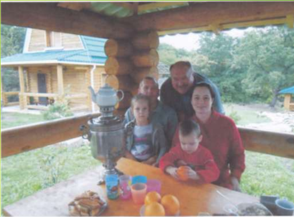
Мой дом, моя семья