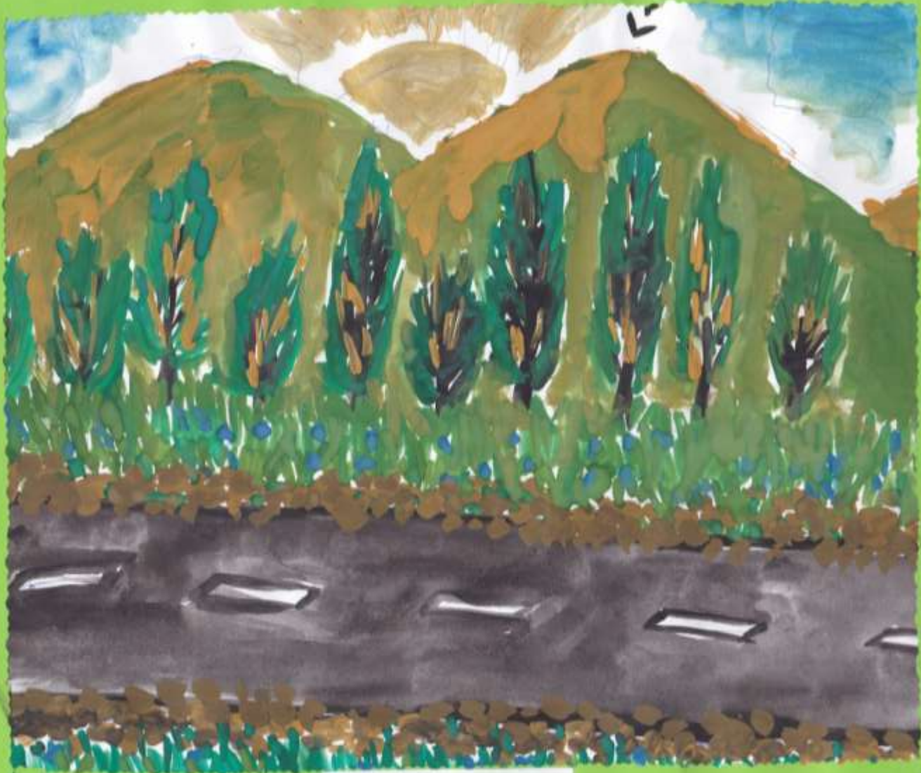
Моя станция Азовская